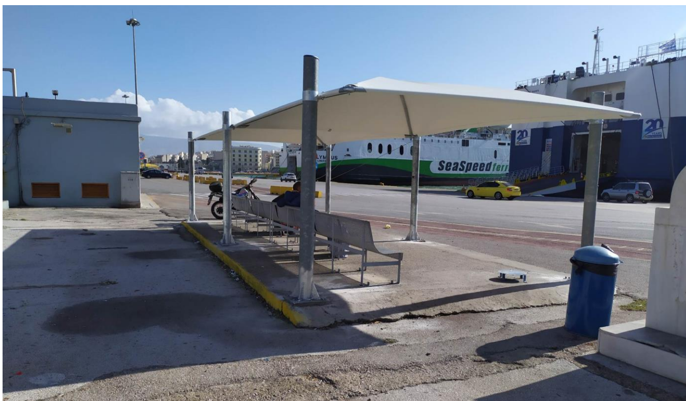
Φωτογραφίες 1&2: ενδεικτικό σύστημα σκίασης τύπου ομπρέλα, το οποίο είναι τοποθετημένο στον Κεντρικό Λιμένα – Πύλη Ε3 (Διαστάσεις ΜΧΠΧΥ = 10,00μ X 5,00μ X 2,30μ)